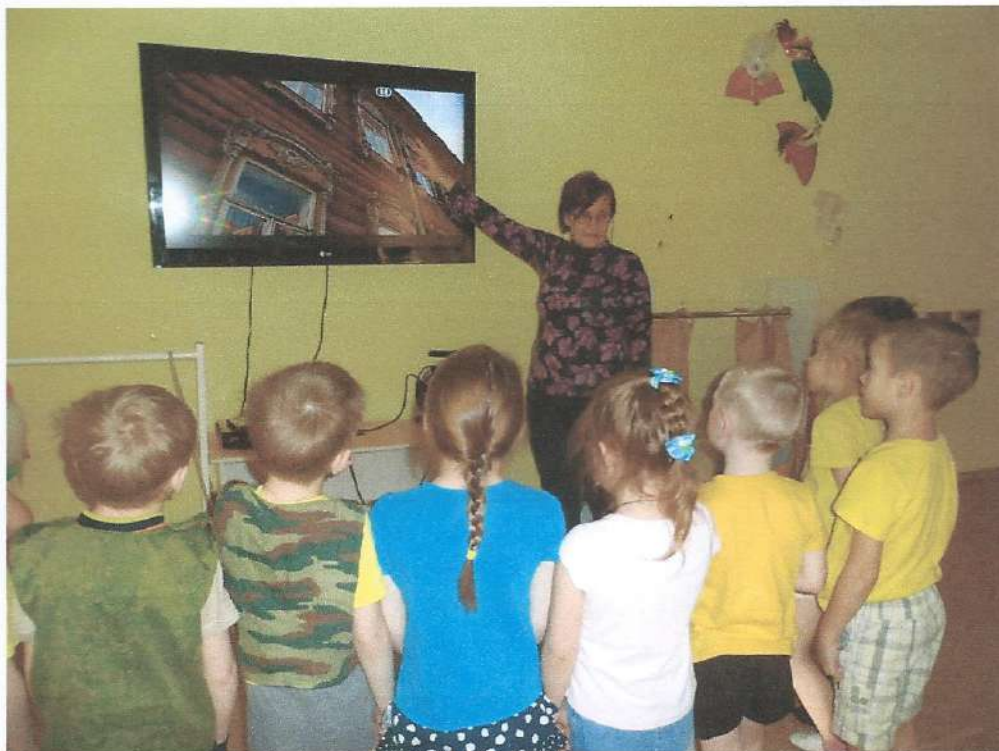
На большом экране отчетливой видны все декоративные элементы (наличники, карниз)